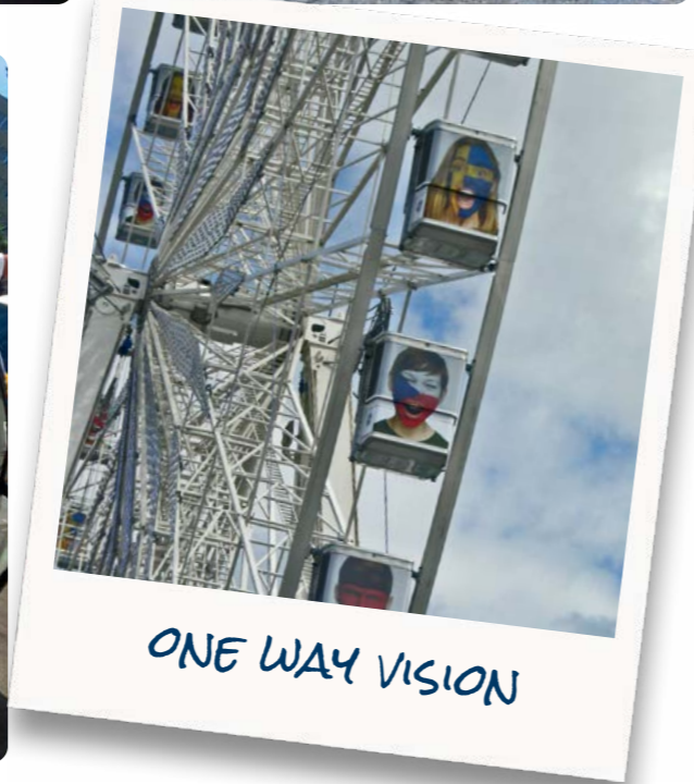
OPTIMAL OWV® | Para transportes públicos